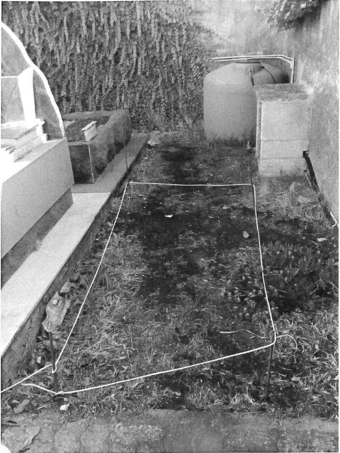
POSIZIONE E INGOMBRO INDICATIVO LOTTO "B"