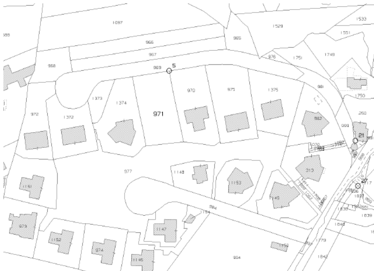
FIG. 2 STRALCIO DI MAPPA CATASTALE FOGLIO 3 PART. 971