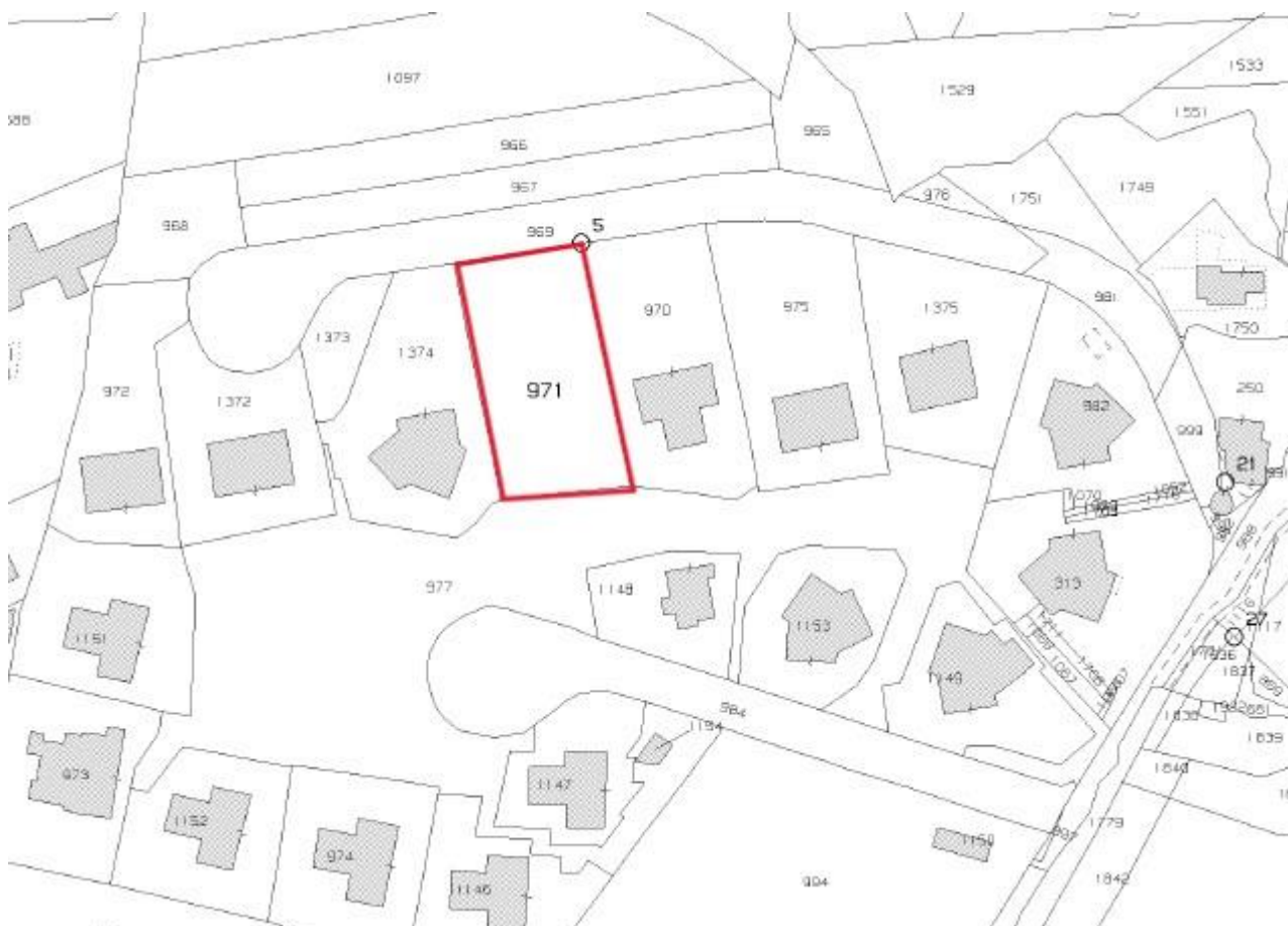
FIG. 3 STRALCIO DI MAPPA CATASTALE CON INDIVIDUAZIONE DELLE AREE D'INTERVENTO FOGLIO 3 PART. 971