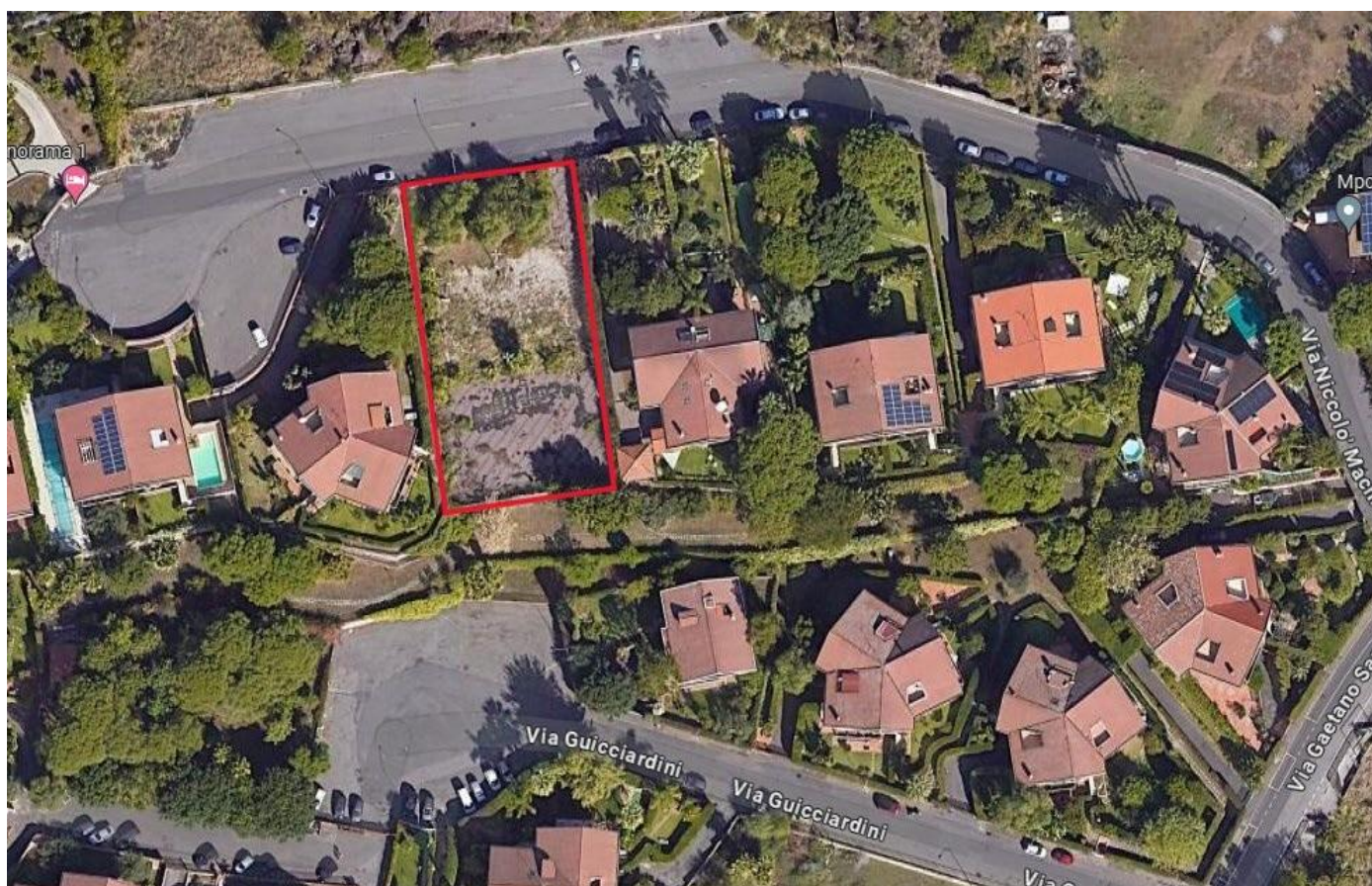
FIG 1 STRALCIO ORTOFOTO CON INDIVIDUAZIONE DELL'AREA OGGETTO D'INTERVENTO

L'area risulta individuata alla sezione terreni del NUOVO CATASTO EDILIZIO URBANO DEL COMUNE DI SANT'AGATA LI BATTIATI AL FOGLIO 3 PARTT. 971 IN DITTA ALL'AMMINISTRAZIONE COMUNALE DI SANT'AGATA LI BATTIATI.