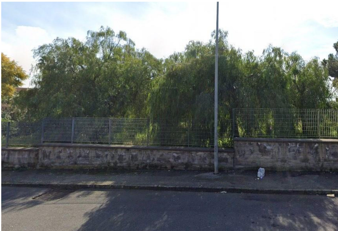
Figura 5 Vista da via Nicolò Macchiavelli

Si riporta di seguito una foto che immortalata lo stato dei luoghi.