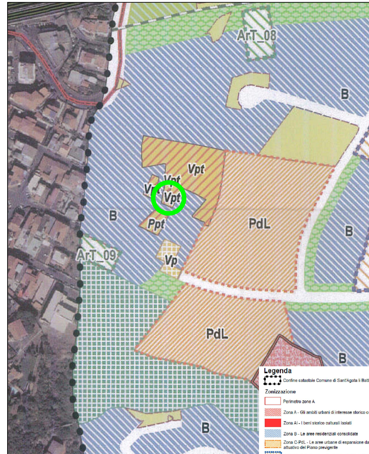
STRALCIO SCHEMA DI MASSIMA - scala 1:2 000